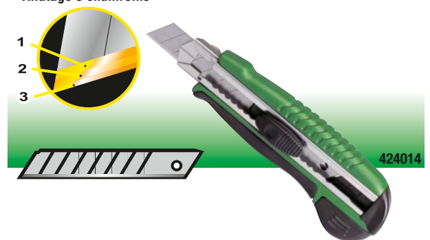
Affûtage 3 chanfreins

424015 : cutter de sécurité, poussoir de sécurité auto-rétractable, changement facile de la lame. Lame trapèze de 0.6 mm, affûtage 3 chanfreins. Manche bi-matière antidérapant.