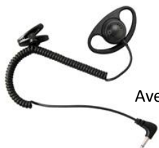
ECC/JACK35 Ecouteur mono Connecteur jack 3.5mm Avec câble torsadé et pince de fixation