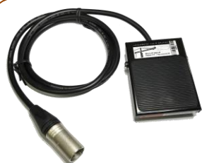
ASPG-PTTXLR3 Pédale de commande au pied Avec connecteur XLR Câble 1.20m (incluse avec réf ASPGMHP)